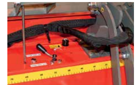
Le réglage de la pompe à huile électrique de la chaîne de coupe se fait facilement avec la vis de réglage indiquée sur la photo.