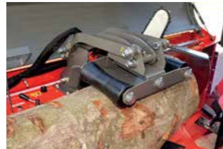
Le dispositif de maintien hydraulique permet de scier facilement les troncs de toutes tailles.

La nouveauté inclut de nombreuses propriétés qui permettent de réduire les coûts pendant la période d'utilisation. La grande capacité d'huile permet de rallonger les intervalles de changement d'huile et de travailler sans interruptions quelles que soient les conditions, depuis l'Alaska jusqu'à l'Australie. Les commandes électriques fiables réduisent le nombre de pièces à entretenir au strict minimum. Le réglage de la quantité d'huile de lubrification de la chaîne de coupe est facile, ce qui évite le gaspillage. En changeant le bidon, il n'est pas nécessaire de verser l'huile d'un réservoir à l'autre. Aucune courroie trapézoïdale n'est nécessaire pour la transmission de la machine, la machine demeure donc fiable et performante au fil des ans.