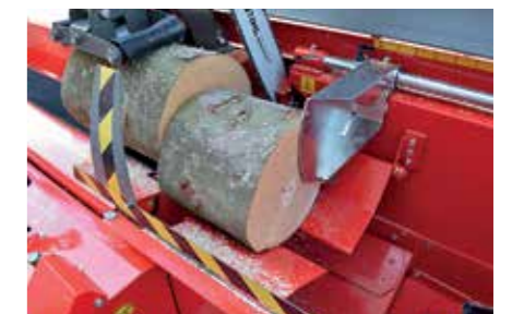
À l'aide des plaques de guidage, les troncs les plus courts tombent dans la tête de coupe d'une manière contrôlée.