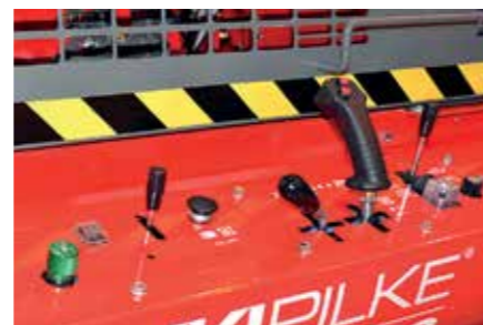
Le panel de commandes est facile d'utilisation et ergonomique.