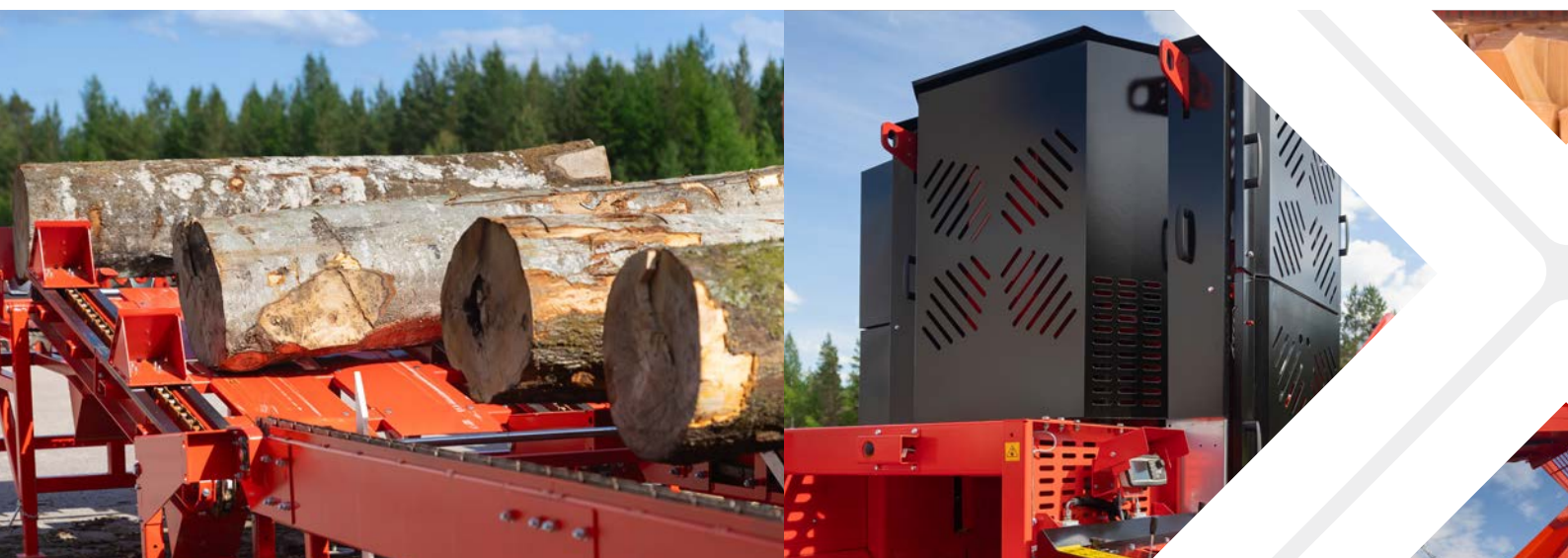
Table pour bûches de bois de chauffage professionnelle Feed 900

La table bûches Feed 900 offre des performances et une praticité supérieures pour les besoins exigeants des professionnels. Ce deck de manutention pour bûches est spécialement conçu pour les grosses bûches d'un diamètre allant jusqu'à 90 cm et est équipé d'une chaîne à roulement dont le fonctionnement est fluide et fiable. La table pour bûches Feed 900 combine efficacité, durabilité et convivialité, ce qui en fait le choix idéal pour la transformation du bois de chauffage. Sa conception modulaire et ses composants de haute qualité vous garantissent une longue durée de vie et un entretien minimal, pour un fonctionnement restant fluide et efficace année après année.